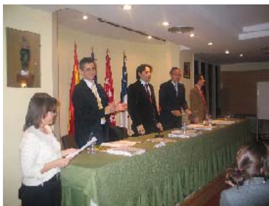
Entrega de diplomas

Cuando los ponentes hubieron concluido sus palabras, se procedió a la entrega de diplomas y los alumnos se dirigieron a la mesa presidencial para recibir los mismos.